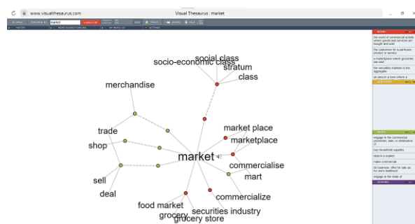
Рис. 2. Карта ума по теме «Market»

К фактическому материалу при изучении темы «Market» могут быть отнесены определения понятий, синонимы, гипонимы, деривативы, устойчивые сочетания. Уже на этапе первичного знакомства с новой темой необходимо стремиться систематизировать новые лексические единицы с помощью различных способов наглядности, например, преподаватель может использовать сервисы для генерирования «карт ума» (mindmaps) (рис. 2).