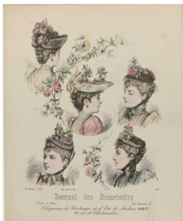
Рис. 1. «Журнал де Демуазель», 1892

выделить основанный в 1833 году во Франции «Journal des Demoiselles» («Журнал де Демуазель», рис. 1), который одним из первых начал издавать черно-белые и тонированные гравюры мод. Он выходил один раз в месяц и был ориентирован не только на женскую и детскую моду, что особенно любопытно, но и культурную жизнь, освещающая сюжеты, связанные с театром, литературой, наукой и образованием. В каждом номере журнала размещалась реклама с указанием адресов ателье. Журнал во многом диктовал стиль модницам Европы и пользовался большой популярностью в Санкт-Петербурге и Москве [24].